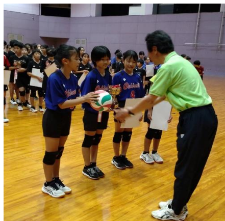
表彰式・Bランク優勝(大開少女キッズ)