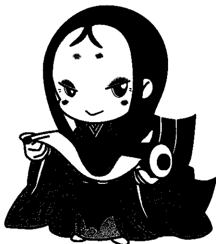
宇治市宣伝大使 ちはや姫

主 催 宇治市・宇治市教育委員会・(一財)宇治市体育協会 後 援 (公財)京都府公園公社・(公財)宇治市公園公社